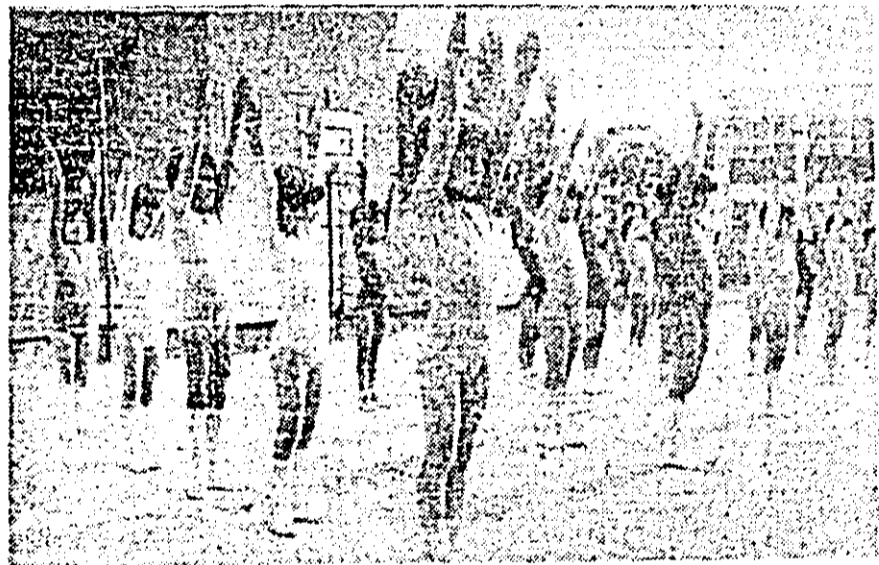
„Bună dimineața, soare!”