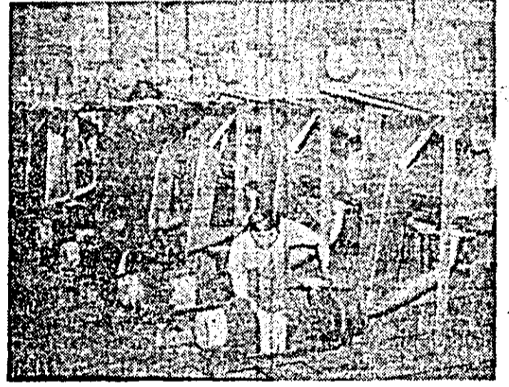
I.M.A.I.A. Un nou lot de produse este pregătit pentru a fi livrat beneficiarilor.