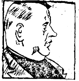
D. dr. Tiso

a fost ales președinte al republicii slovace