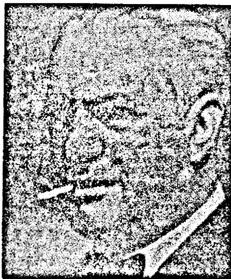
C. ARGETOIANU prim-ministru

S'a încheiat atunci frontul disciplinei și