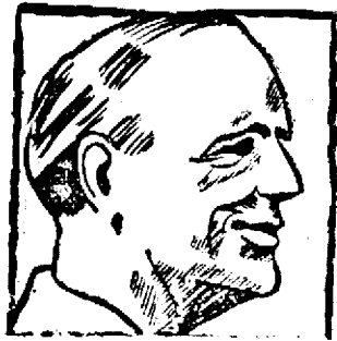
D. Von Ribbentrop

In Camera Comunelor d. Chamberlain a spus: