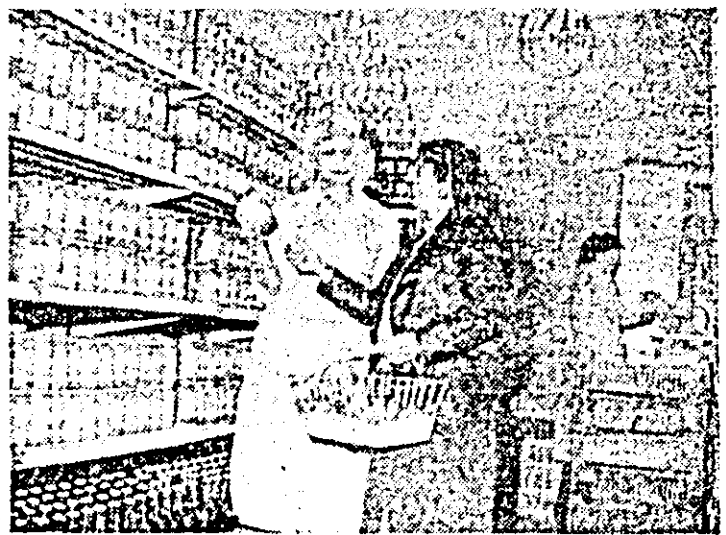
Aspect din magazinul alimentară cu autoservire „Traian”.

Deci, concluzionînd diferența de 10.416 kg la hectar între cele două unități, din care „Podgoria” obține în total 41.666 kg la hectar și depășește planul de producție la această cultură cu 4.266 kg, iar „Siriana” care obține doar 31.250 kg la hectar și nu îl realizează cu 6.150 kg la hectar, este pusă pe seama faptului că la cea de a doua unitate s-a efectuat o fertilizare insuficientă, că mai ales datorită densității scăzute la unitatea de suprafață. Evident, din această experiență s-au tras învățăminte prețioase astfel că la anul — să sperăm — se va proceda în consecință.