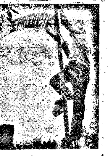
„Jos cu firma CAP-ului”. La modul cel mai propriu.