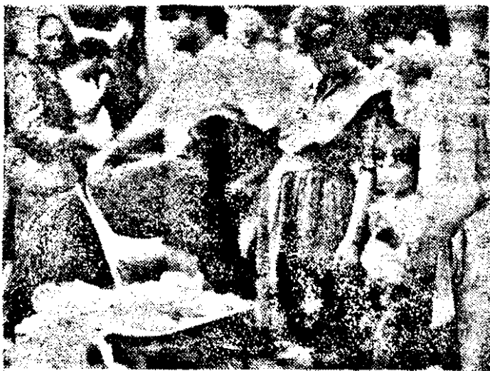
La privatizări se găsește și porumb fier. La preț liberalizat: 35 lei ştiuletele.