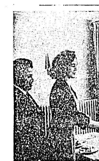
ELVETIA. — La Salonul Internațional de turism și sport din Lausanne, filmul românesc „Vacanță la Mamaia” a fost premiat în cadrul celui de-al III-lea Concurs Internațional ca cel mai bun film turistic al anului 1966. În fotografie: Paul Henri Jaccard înmînînd premiul reprezentanților României.

Un element care a fost remarcat la aceste alegeri este sporierea numărului de voturi acordate ceterorilor de extremă dreapta reprezentate de Partidul național democrat. Acest partid a obținut 3,9 la sută din voturi (în decursul altor alegeri nu realizase decît 1,8 la sută din voturi). Deși acest rezultat nu va permite elementelor de extremă dreapta să trîmbie vreun reprezentant în dieta hamburgheză, totuși dublarea numărului de voturi acordate Partidului național democrat provoacă îngrijorare în cercurile politice locale. Primarul Hamburgului, Herbert Weichmann, a dat glas acestei îngrijorări, relevînd că este „urgent necesar” să se analizeze rezultatele alegerilor sub prisma intensificării activității extremiștilor de dreapta.