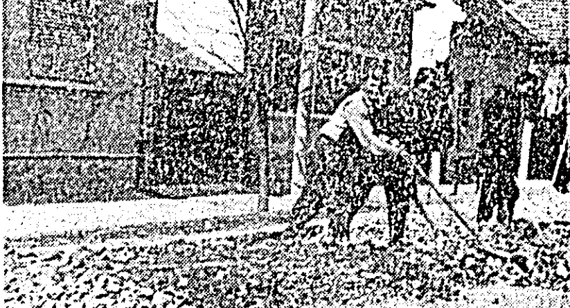
Pe strada Gh. Hălmăgeanu se lucrează în aceste zile la pavarea străzii.