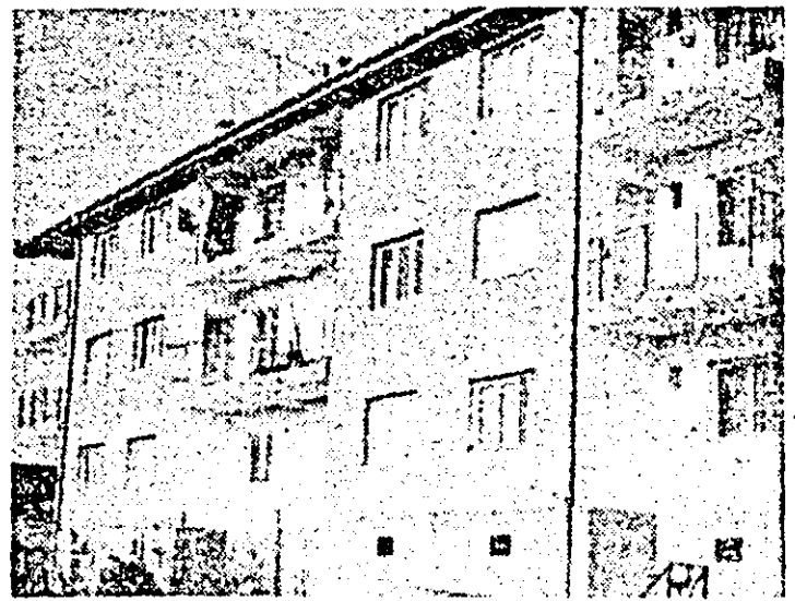
Construcții noi pe harta edilărilor a comunei: noul bloc de locuințe, cu 12 apartamente.

Tara întreaga se pregătește de alegeri — eveniment social-politic cu profunde semnificații, menit să întărească și mai mult democrația noastră socialistă, unită cu poporul în jurul partidului, al secretarului său general, tovarășul Nicolae Ceaușescu. Acum, când au mai rămas doar câteva zile pînă cînd toți cetățenii patriei, cu drept de vot, români, maghiari, germani sau de alte naționalități, tineri și vîrstnici, femei și bărbați se vor afla din nou în fața urnelor pentru a-i alege ca deputați în consiliile populare municipale, orașenești și comunale pe cei mai buni dintre cei buni muncitori, țărani și intelectuali, oamenii acestor minunate meleaguri românești continuă să privească retrospectiv asupra realizărilor obținute în actuala legislatură. În egală măsură, cu simț de adevărați gospodari, de vrednici făuritori ai societății noi, socialiste, chibzuiesc asupra a ceea ce este necesar să înfăptuiască în perioada imediat următoare sau în perspectiva noii legislaturi în interesul obștii și cu contribuția întregii obști.