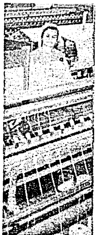
Aspect de muncă în atelierul pregătire al întreprinderii textile „UTA”.