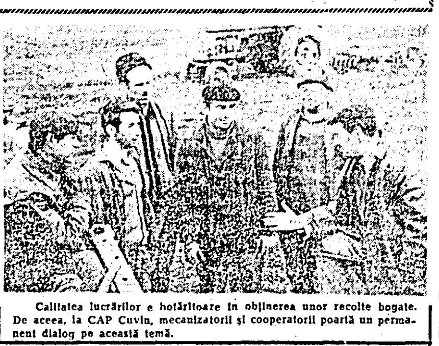
Calitatea lucrărilor e hotărîtoare în obținerea unor recolte bogate. De aceea, la CAP Cuvîn, mecanizatorii și cooperatorii poartă un permanent dialog pe această temă.