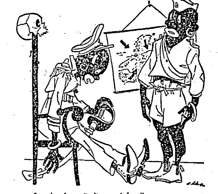
(Desen de RIK AUERBACH)