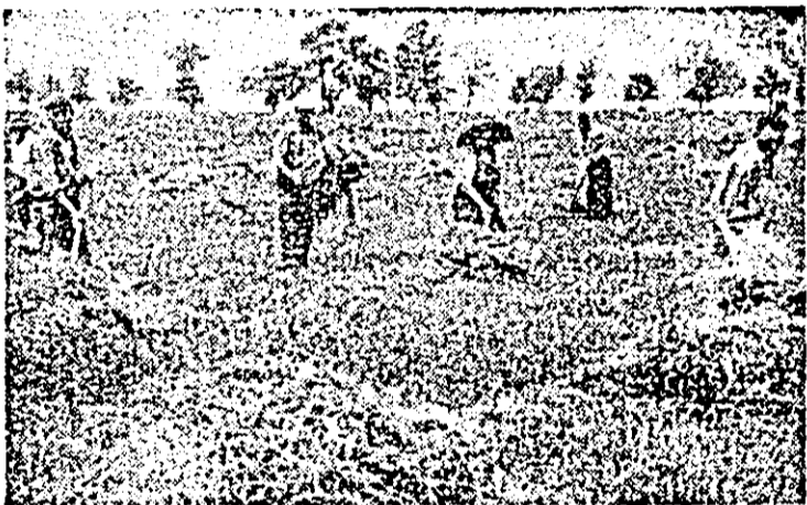
Cooperatorii din Secușiu acționează de zor la asigurarea bazel furajere, lădă un aspect de la stringerea flinului.