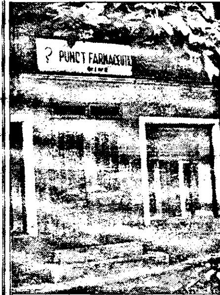
Pentru că lacătul de la intrare n-a mai fost deschis de ani buni, sătenii din Sănmartin își procură medicamente din localitățile vecine...