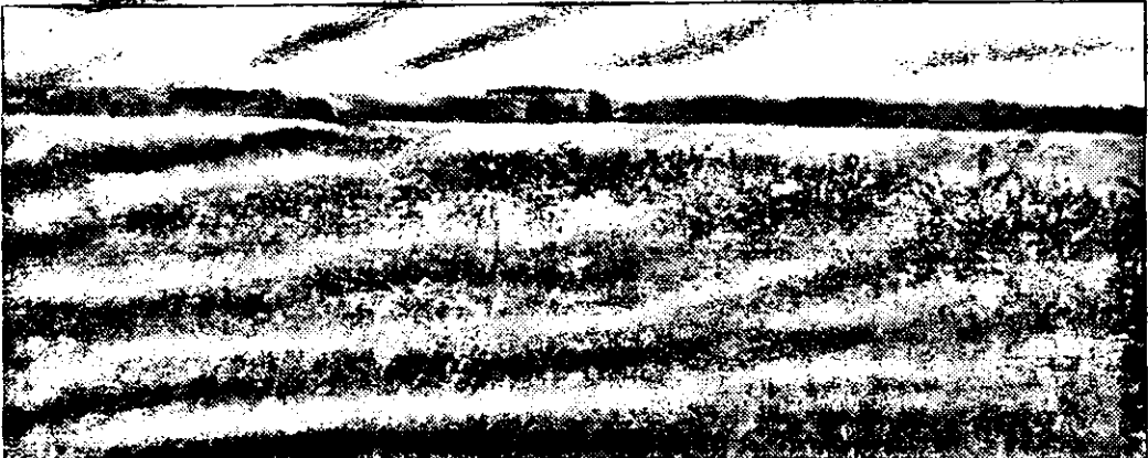
Între zeci de hectare cu lanuri de buruieni, abia mai „respiră” câte un rând-două de porumb.