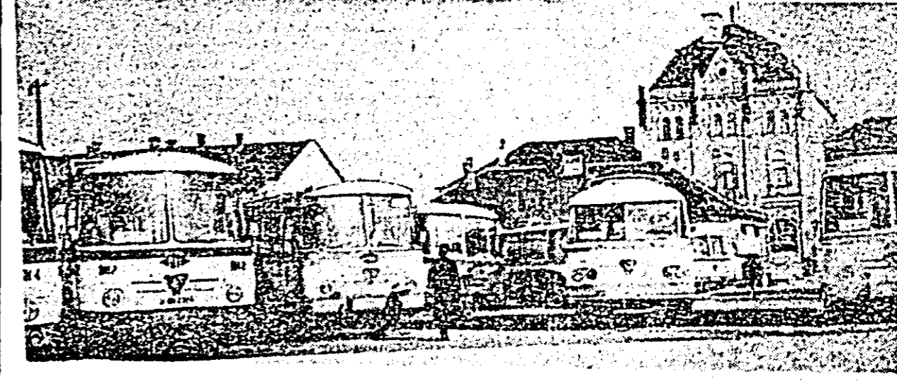
Plaza Gării. Autobuzele întreprinderii de transporturi auto sînt gata de a pleca într-o nouă cursă. Și aici conducătorii auto se preocupă de buna gospodărire a benzinei.

gat cu semănătorile, la cooperativa „Steagul roșu” capacitatea remorcilor pentru siloz a fost aproape dublată prin supraînălțare cu plasă de sîrmă, acțiune ce a fost extinsă și la secțiile de la CAP „Ogorul” și „Avîntul”, asigurarea unor condiții mai bune de reparat în secțiile din Peregul Mare, Turzu și altele încît motoarele să folosească cantitatea optimă de motorină etc. Prin aceste măsuri se preconizează economisirea unor însemnate cantități de motorină, astfel încît în viitor distanța dintre polii economiei și risipei să se lichideze în favoarea primului, să se închidă definitiv toate robinetele risipei. L. P.