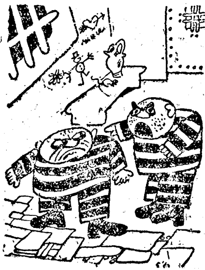
Micsoda hang ez? — Tudja Ön, kivel beszél?!

Ingatlan- és vállalati tulajdonosok légvédelmi kötelezettségei. Az összes ingatlanok, nyilvános helyiségek, kereskedelmi és ipari vállalatok tulajdonosai az aktív és passzív légvédelmi törvény 14. szakasza értelmében — amely a Monitorul Oficial 1939. március 6-iki, vagyis az ötödik számban jelent meg — kötelesek mindazon helyiségeket, illetve az ingatlanok külsőjét, belsőjét, pincéjét, padlását, ezenkívül az udvart, kertet, beépítetlen területet, stb. a köz érdekében minden ellenérték nélkül átengedni, hogy ott az esetleges légvédelmi munkálatokat, felszereléseket elvégezzék. A rendelkezés ellen vétőket az A. A. T. törvény értelmében hat hónaptól két évig terjedő fozházbüntetéssel és 5 ezer leittől 50 ezer leig terjedő pénzbüntetéssel sújthatják.