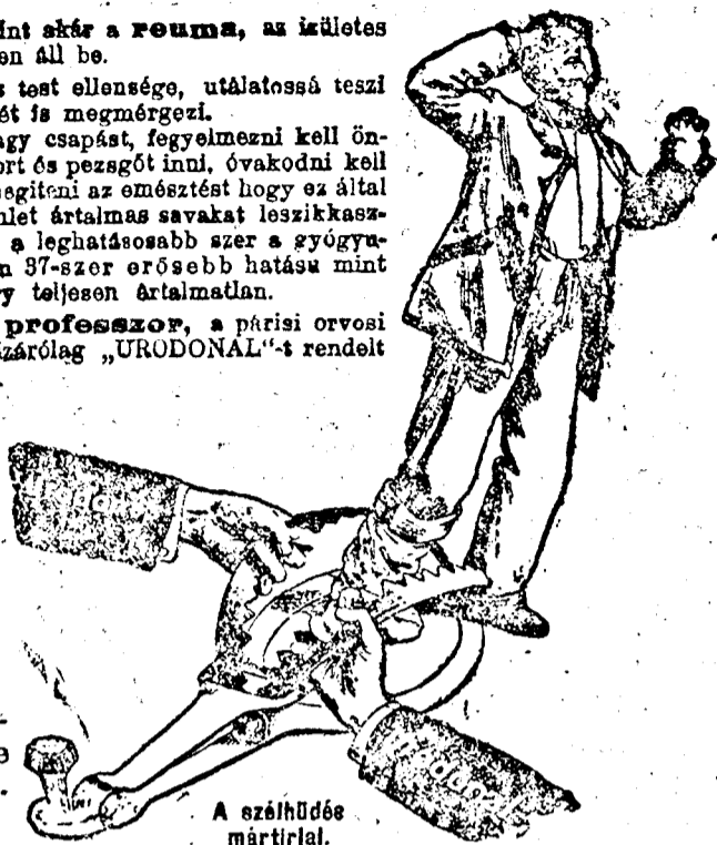
A szélhűdés mártírja.

Chatelain laboratóriumok 2 bis. Rue de Valenciennes, Paris.