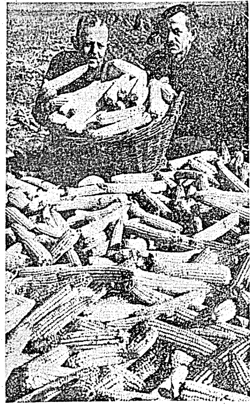
Recolta de porumb trebuie strînsă la timp și fără pierderi. Acest lucru îl fac și colectivității de la Aradul Nou. Iată pe doi colectivști din brigada I-a, la încărcatul porumbului.

Pentru următoarele trei zile: vreme relativ frumoasă cu temperatura la început staționară, apoi în creștere ușoară.