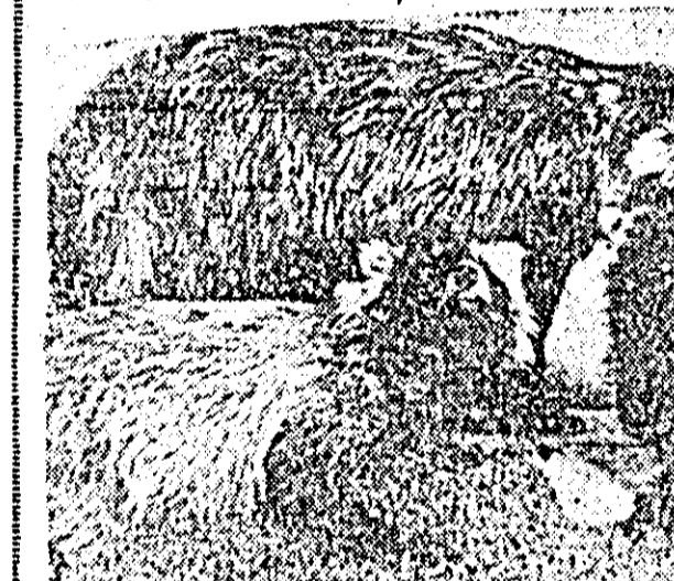
Cinele Enot, pe care-l vedeți în clișeu de mal sus, este original din America. Cu ani în urmă el a fost colonizat în Uniunea Sovietică de unde s-a rășpândit și la noi. Laboratorul de taxidermie din Arad a naturalizat trei exemplare și alte trei se află în captivitate.