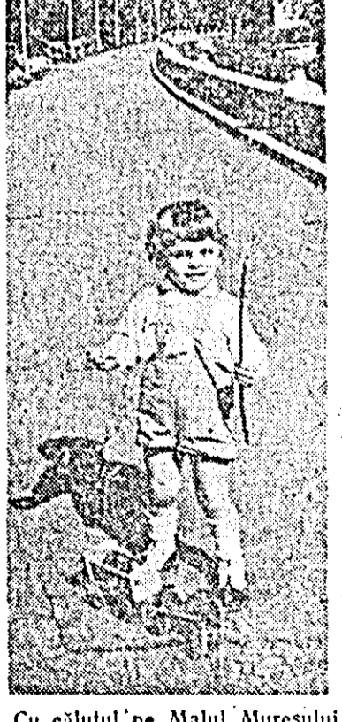
Cu călușul pe Malul Mureșului.

UNESCO va scoate o ediție de lux, în care va prezenta atît festivalul, cît și expoziția, cuprinzînd și principalele lucrări de cuvine din timpul colocviului.