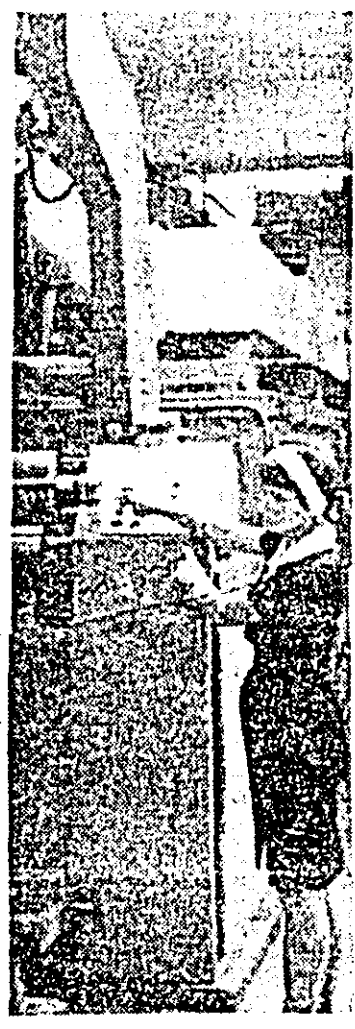
Aspect de muncă în secția (la linia) a Întreprinderii textile.

— Mai concret? — Aș dori să mă refer, cu acest prilej, la extinderea utilizării tehnologiei de sudură în mediu de bioxid de carbon, care asigură o creștere cu 33 la sută a productivității muncii, înlătură risipa de electrozi și reduce în mod substanțial consumul de energie electrică. Acest lucru a fost posibil și ca urmare a