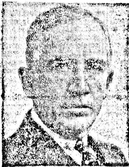
NORMAN DAWIS Amerika világbéke-delegátusa

Londonból jelentik: Norman Dawis amerikai fődelegátus meglepetésszerűleg az angol fővárosba érkezett. A diplomata Londonba érkezése rendkívül fontos fordulatot jelent a leszerelési tárgyalások alakulására. Roosevelt elnök ugyanis meg-