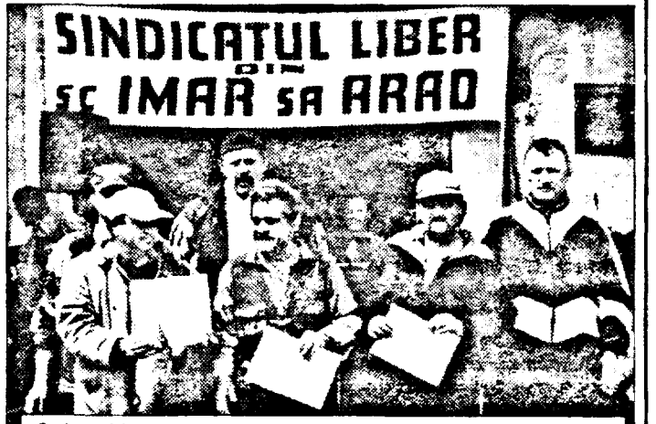
CEI MAI BUNI PESCARI - Sindicaliștii de la IMAR, alături de Helmuth Duckadam - cel care a oficiat premierea.