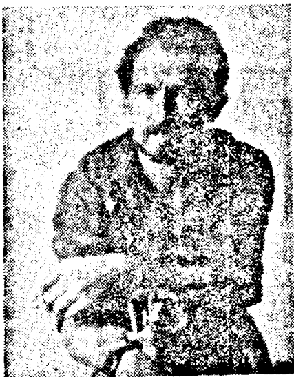
AUTOPOURTRET 1990 LA 0.60 LEI/KWH