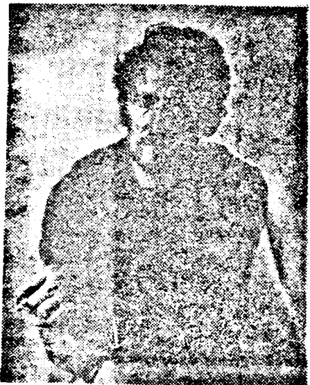
AUTOPOURTRET 1992 LA 6 LEI/KWH