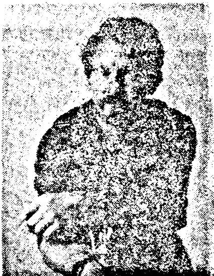
AUTOPOURTRET 1993 LA 28 LEI/KWH