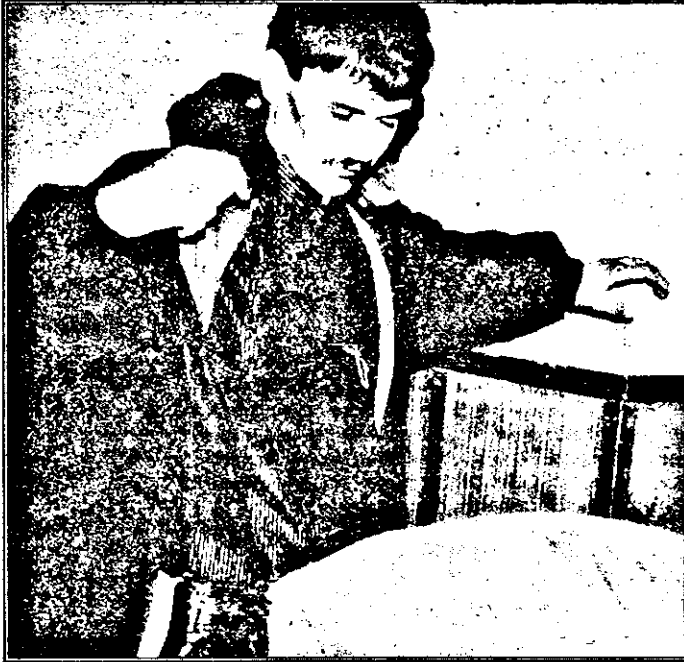
Legitimarea și percheziția corporală - un procedeu des utilizat de patrulele de noapte ale poliției în cazul indivizilor suspecti, spre liniștea și siguranța noastră.

un apartament este închiriat unor cetățeni străini pentru doar 20 de mii de lei pe lună? Între timp, polițiștii verifică pașapoartele turcilor, identitatea celorlalte persoane aflate în încăpere.