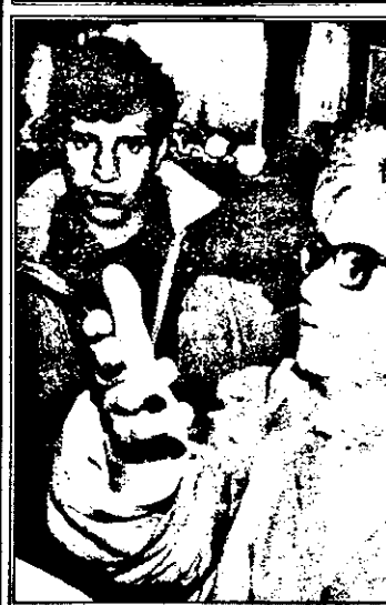
Cetățenii turci primiți în gazdă - o permanentă sursă de scandaluri. Explicațiile date poliției de către proprietara apartamentului sunt prea puțin convingătoare...

anunțat prin stația radio. Oamenii legii rămân să-și facă datoria. Se pare că distracția îi va costa pe turci.