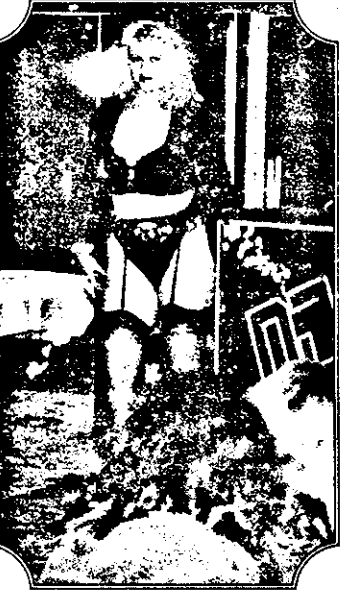
Atracții ale nopții la „Bulevard”

Cu toate că nici o reclamă nu ne-a avertizat, știam că nu departe este un restaurant deschis non-stop, pe nume „Korona”.