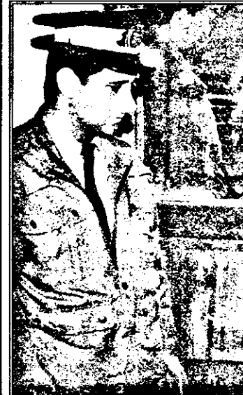
Săliile de așteptare ale stațiilor CFR au devenit un loc de refugiu al călătorilor fără... destinație, sau al celor atinși de febra paharelor în plus.