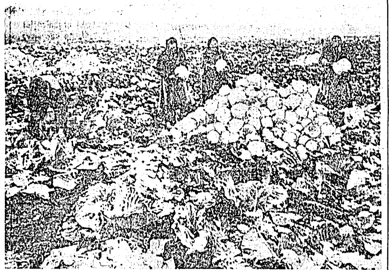
Grădiniștii este o ocupație specifică colectivităților din Aradul Nou. Pe lângă celelalte culturi de legume, varza de toamnă care se recoltează acum, după cum se vede în clișeu, aduce și ea veniturii gospodăriei colective.

SCARLAT CALIMACHI: Un călător prin U.R.S.S.; 108 pag. — 2,50 lei. ESPLA. IOAN GRIGORESCU: Obsesta. 200 pag. — 4,25 lei. (Ed. tinerețului). MARIA ARSENE: Vremuri și semne — povestiri. 320 pag. — 7,70 lei. ESPLA. E. DRABKINA: Pesmeții negri; 160 pag. — 2,75 lei. ESPLA. Cartea rusă. GEORGE BALAN: Muzica, artă greu de înțeles? (Colecția „Muzica pentru toți”). 208 pag. — 5,50 lei. Ed. muzicală. ION D. VICOL: Cîntăm pe note. 256 pag. — 14 lei. Ed. muzicală.