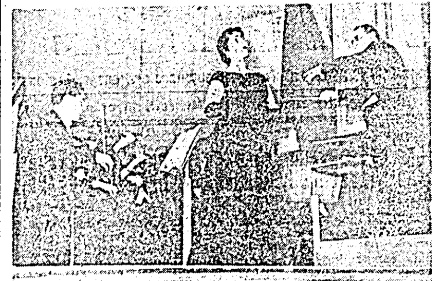
IN CLIȘEU: un aspect din timpul concertului.

Aplauzele prelungele ale publicului prezent la concertul din seara zilei de 19 noiembrie, au răsplătit unul din cele mai reușite concerte ale Filarmonicii de stat Arad, condus de dirijorul bucuureștean Constantin Bugeanu, cu participarea sopranei germane Gheine-Vagner, prim solistă a operei din Riga, Artistă a Po. orului din RSS Letonă.