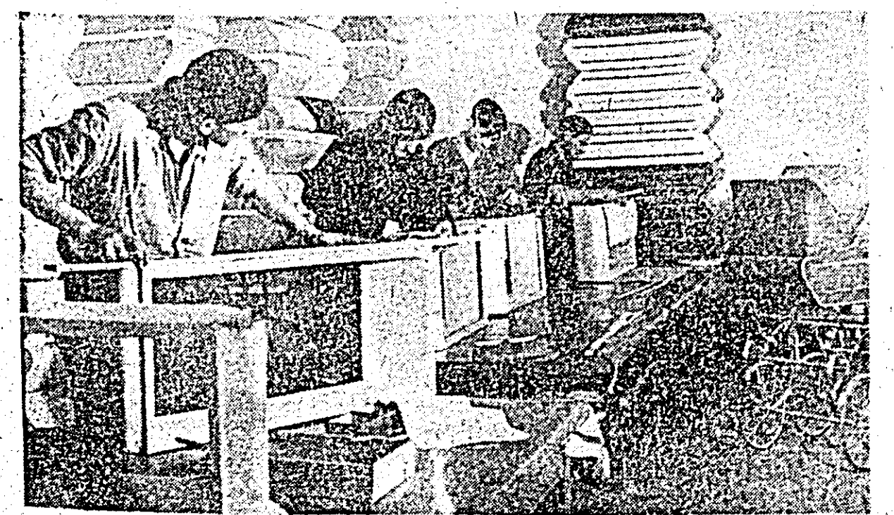
Electrometal Arad. Mult solicitările cărucioare pentru copii sînt tapitate cu grijă de către muncitorii atelierului tapijerie.