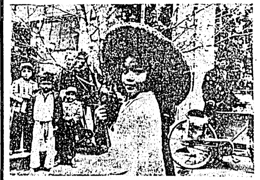
Tradiționala sărbătoare a Anului Nou vietnamez, care vestește începutul primăverii.