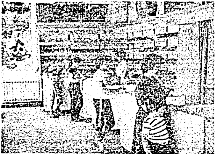
În moderna zonă de blocuri Micălaça V s-a deschis recent un nou magazin cu articole pentru copil. În ima- gine: aspect de la rationally tricotate-incălfămînte.

Lucrările n-au fost e- xecutate nici pînă azi, cînd au trecut opt ani de la da- rea blocului în folosință. Cînd ploaia mai zdravăn apa se infiltrează — și a- cum, ca și atunci, în 4 iu- lie 1977 — pe la rosturile dintre etaje la fațade. Lo- catarii blocului Y4 se întreabă dacă mai are vreun rost să solicite construc- torului și OCVL rechitu- rea... rosturilor. Ei se glin- desc, probabil, că în locul meseriașilor care s-au execu- te remediile, le va fi trimi- să o nouă adresă, prin care să le fie comunicat un alt termen. Așa să se întim- ple, oare? Sau vor găsi IACM și OCVL „unelte” necesare pentru „a demon- ta” acest „carusel” al amînărilor? Așteptăm... A. I.