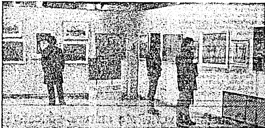
Aspect din expoziția omagială de artă plastică deschisă în sala „Alia”.