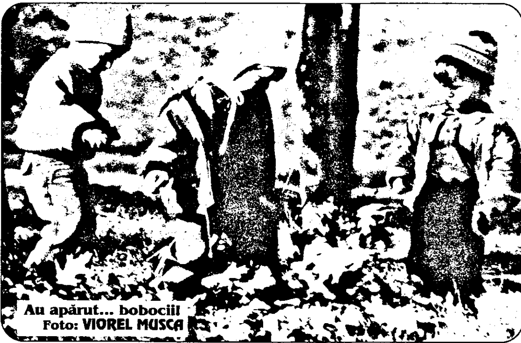
Au apărut... bobocii

În pagina a 6-a, „FEMINA” vă propune o temă incitantă: Ce fac doamnele când soții le sunt plecați în delegație?