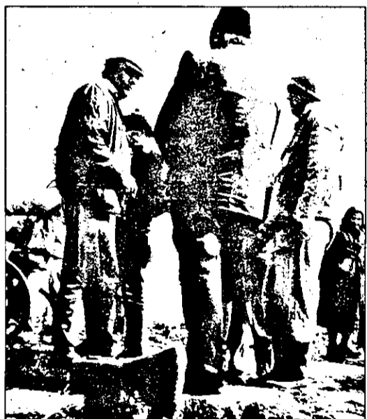
Toporul - un „argument” din păcate invocat în conflictul de la Măndruloc, generat de împărțirea pământului.