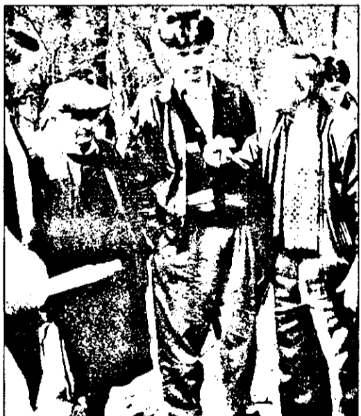
Primarul comunei Vladimirescu încercând „la fața locului” să aplaneze un conflict, care riscă să degeneze...