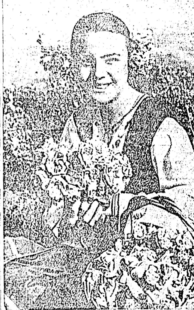
Pe plantațiile de trandafiri din R.P. Bulgaria a început culesul petalelor din care se extrage renumitul ulei de trandafir. Minunatele condiții climatice ale Văii trandafirilor, situată între Munții Stara Platina și Sreda Gora, permit să se cultive aici soluri prețioase de trandafir cu un bogat conținut în uleiuri eterice. În clișeu: o tînără bulgară la culesul trandafirilor.

Nu a trecut mult timp de cînd pe străzile Budapestei au apărut primele autobuze secționate. De atunci locuitorii capitalei ungare au învățat să aprecieze noul vehicul care, pe lângă faptul că are o capacitate mult sporită, a contribuit la descongestionarea străzilor aglomerate reducînd numărul personalului de deservire. Recent, după modelul autobuzului secționat, a fost elaborat prototipul unui troleibuz secționat. Noul vehicul seamănă cu un tramvai cu remorcă, fiind instalat pe trei axe în așa fel încît troleibuzul poate întoarce pe un loc mult mai mic decît un alt vehicul ne-secționat de aceeași mărime. Troleibuzul este deservit de un șofer și un singur încasator. Publicul călător se urcă pe secțiunea din spate și poate înainta în prima secțiune unde sînt două uși de coborîre. În timp ce un troleibuz obișnuit are 80 de locuri, noul vehicul poate transporta concomitent 150 de persoane.