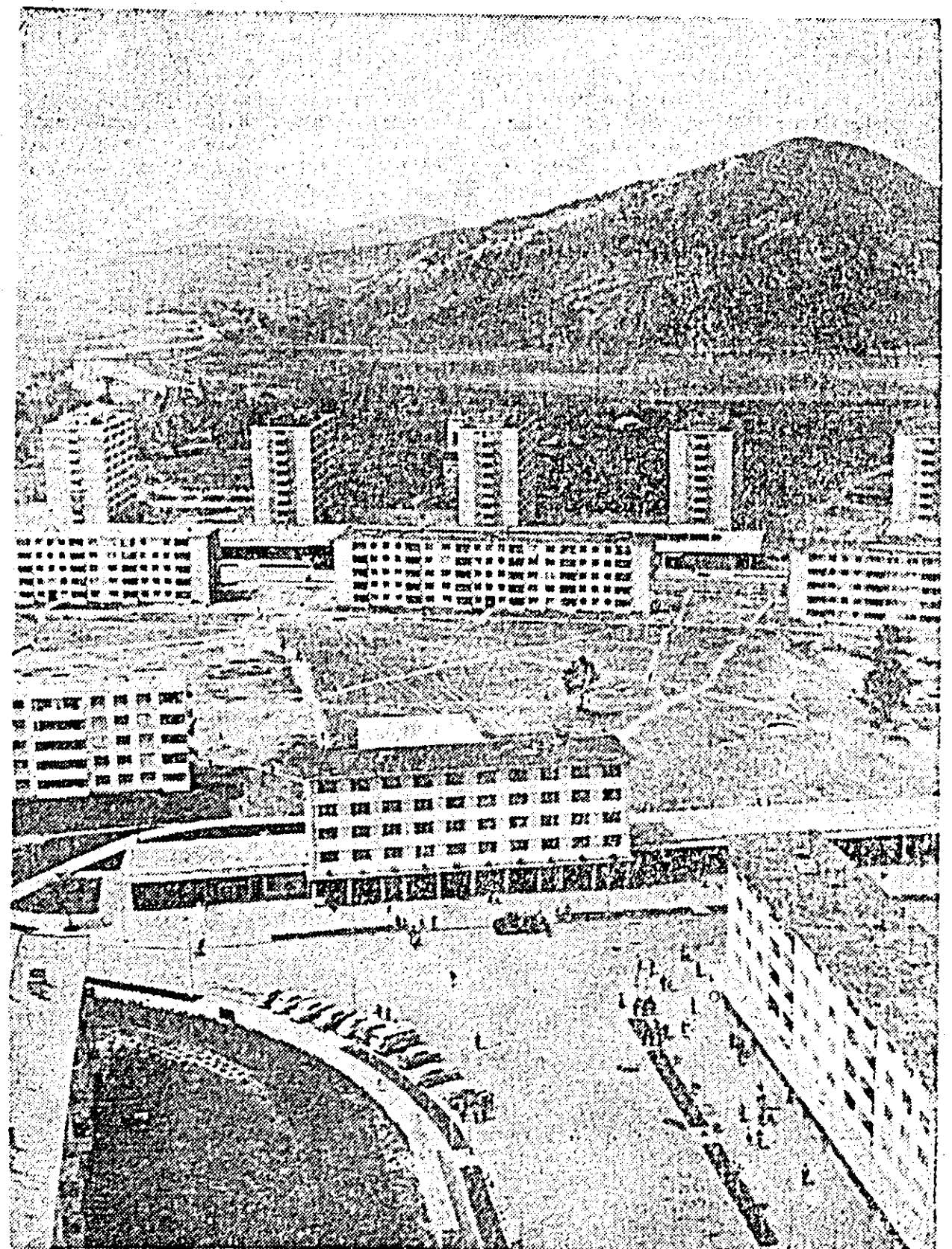
Aspect din noul pelsaj al Oneștiului.

Convorbirile s-au desfășurat într-o atmosferă deosebit de cordială și de deplină înțelegere reciprocă.