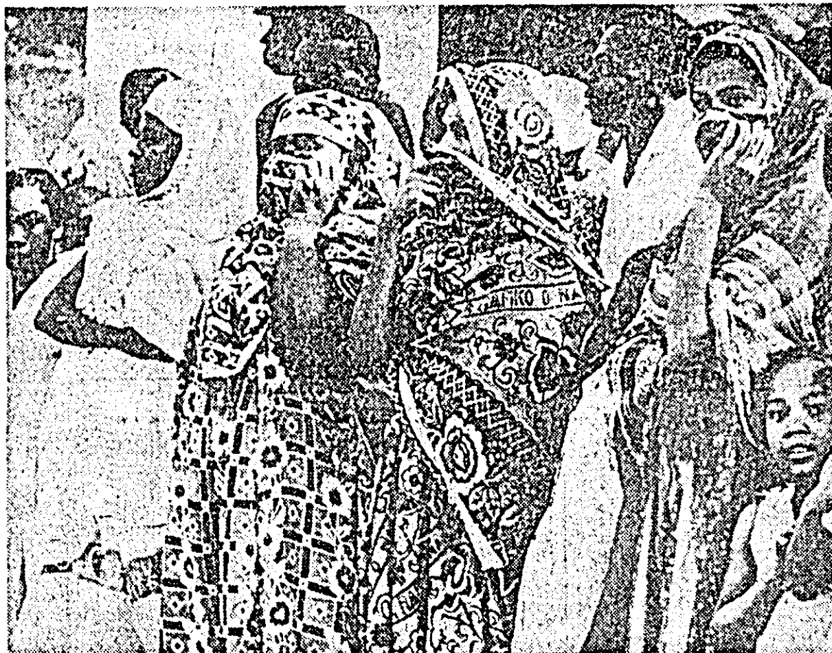
Clășul nostru reprezintă un grup de femei din Diego Suarez, cel mai mare port din insula Madagascar, în costumele lor de un colorit viu. Patria lor, republica Madagascar de astăzi, și-a cucerit în 1960, independența față de colonialismul francez.

Vizita președintelui francez în Peru va dura trei zile. Sâmbătă, președintele de Gaulle a ținut un discurs în parlamentul peruvian, convocat în sesiune specială.