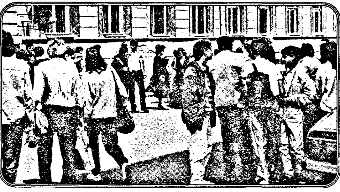
Mulți mai au speranță să vină un tramvai. Dar cetățenii Aradului sunt sfidați, din nou, de 10-15 vatmani.

Cară ar fi dezavantajul pentru dl Iliescu? Indoctrinat cu idei comuniste și socialistice de tip sovietic, dl Iliescu ar trebui să facă o spălare a creierului ca să scape de acest balast periculos. I.IERCAN (Continuare în pagina 2)