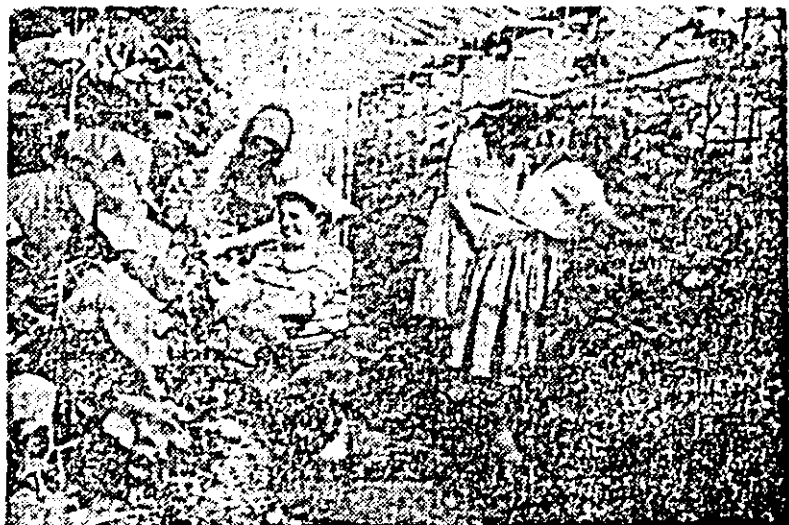
La ferma a XV-a din Curtici a asociației de sere a început culesul și livratul castraveților, anunșindu-se o recoltă bună.