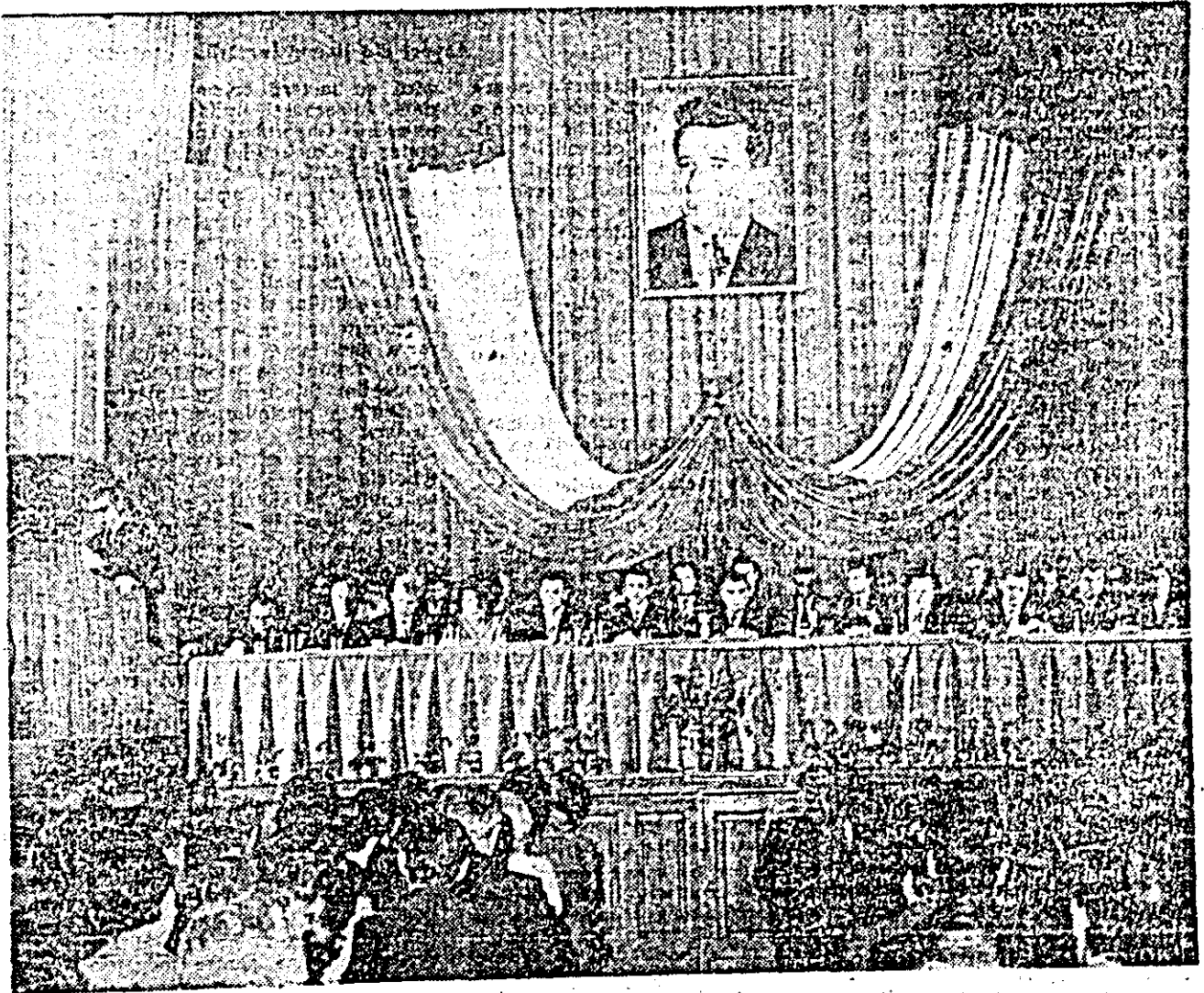
Prezidiul Conferinței extraordinare a organizației județene de partid Arad.