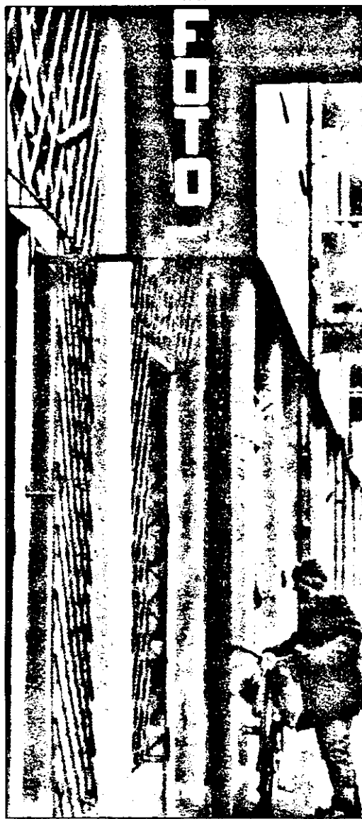
La Ineu, în centrul orașului se află „Fotograf”. Ce-o vrea să însemne acest „rap”, rămâne, pe mai departe, o enigmă...