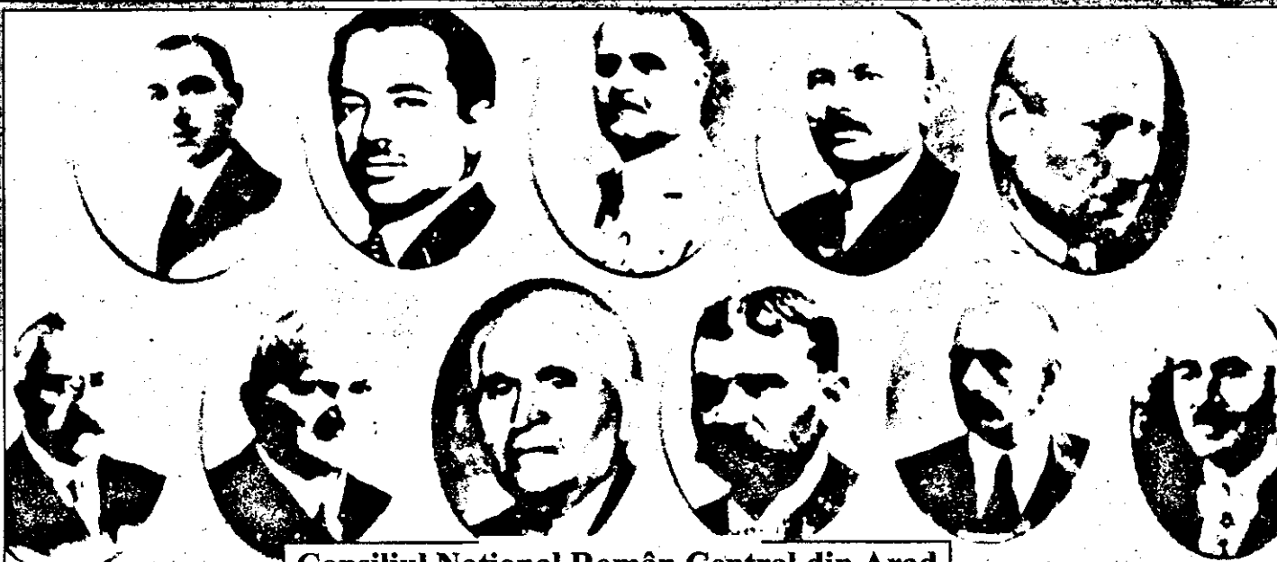
Consiliul Național Român Central din Arad