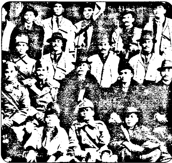
Delegația Ineuului la Marea Unire.