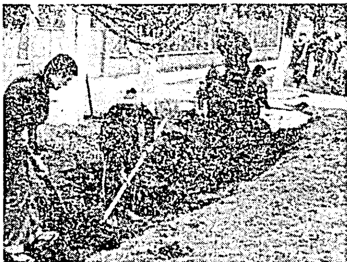
Elevii școlii generale din satul Galsă participă în aceste zile la lucrări de înfrumusețare a localității.