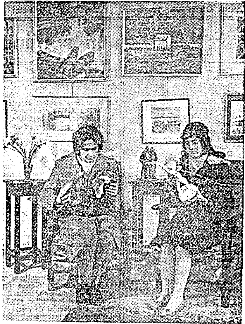
Galeriile de artă din orașul Arad sînt vizitate zilnic de numeroși iubitori ai artei plastice. În clișeu: un aspect din Interiorul Galeriilor de artă.