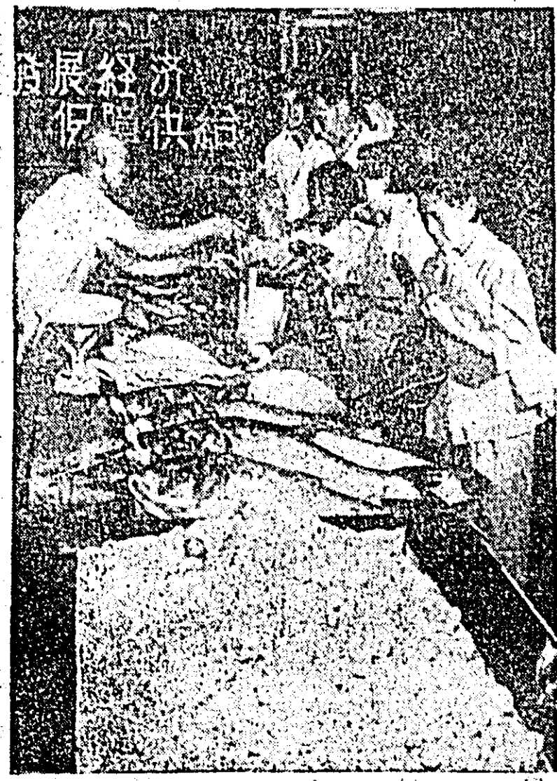
CHINEZA. O plată dintr-un oraș chinezesc.