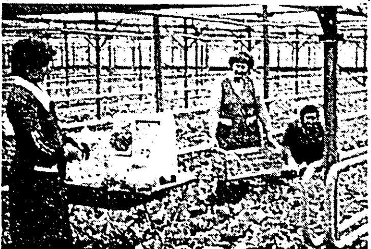
La ferma nr. 4 a A.E.C.S. Sere Arad se recoltează și se expediază beneficiarilor recolta de salată.