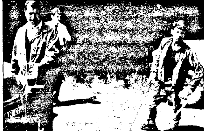
In timp ce ne întorceam de la Cuveșdia, „fratele” Dorin transporta cu un ARO, ultima „captură”, pe minorul handicapat din imagine, pe care l-a găsit pe stradă...

FLORIN TRUȚ (Continuare în pagina a 3-a)