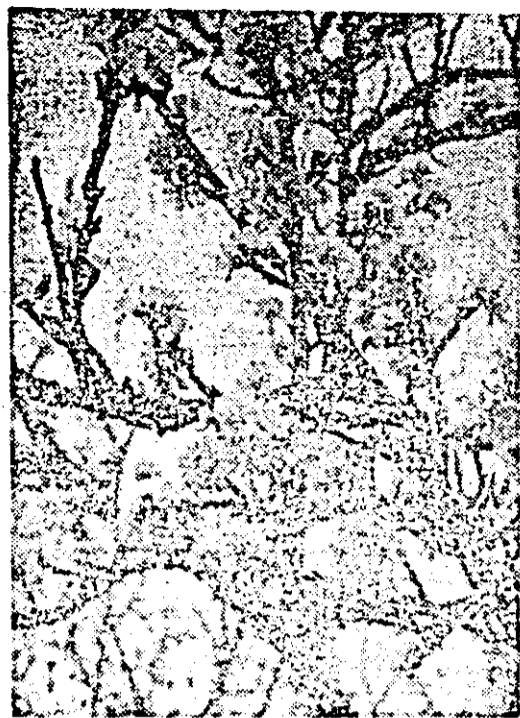
Au înflorit cașii.

reocupările aliştilor din mial tehnici alcul pentru ina innoire odernizare a actiei au ca realizarea u echipamente mare comple e tehnică, la nivel calitativ le asigură mpetitivitatea piața externă. e acesteia se rie și noul e- ament de per- t pe bandă — 0 intrat recent producția de e a întreprin- i de echipa- te periferice București. d produs, cu i utilizării în ulul electro- este destinat nicalculatoare-