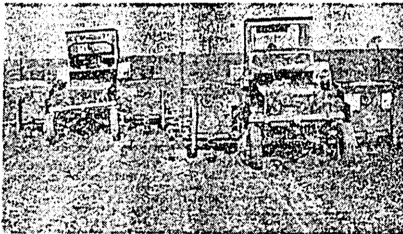
La ferma a IV-a legumicolă a cooperativei agricole din Semlac se urgentează ritmul plantării cartofilor.