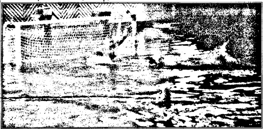
Bonchiș (Crișul Oradea) din nou, față în față cu portarul dinamovist Simion.