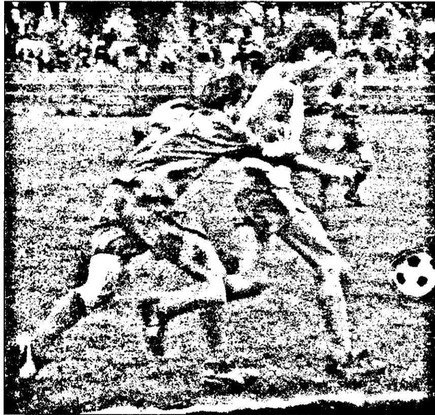
Fază din meciul Gloria Arad - Telecom, încheiat cu victoria primei echipe.