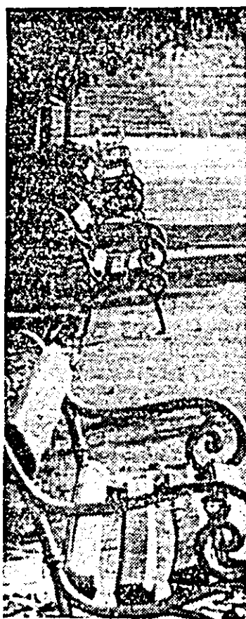
Toamnă tîrzie în parc...