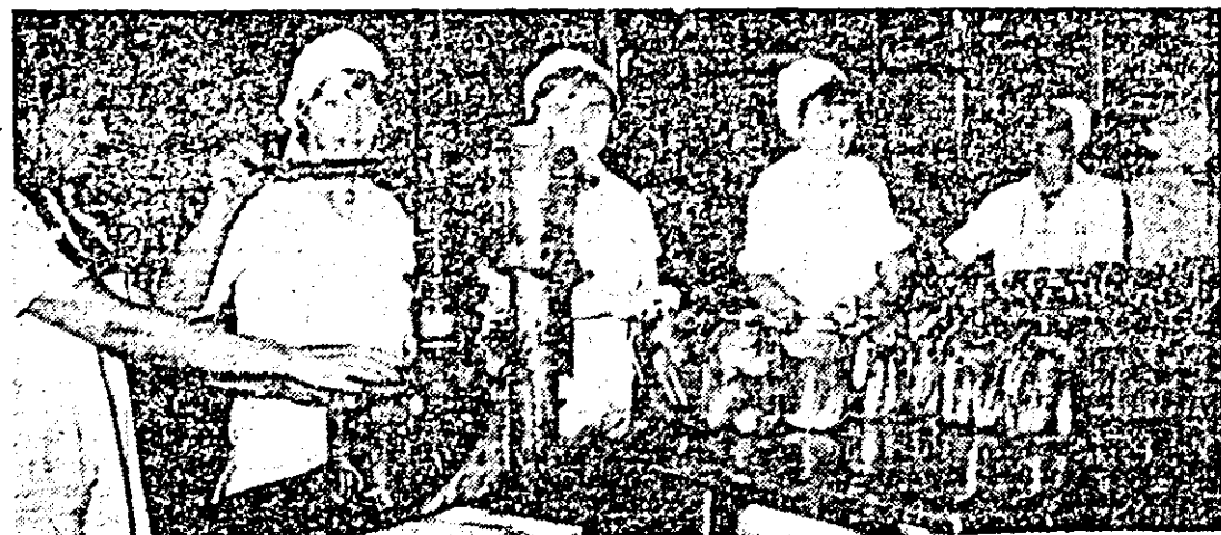
La Întreprinderea pentru producerea și industrializarea legumelor procesul de producție se deslășoară din plin.