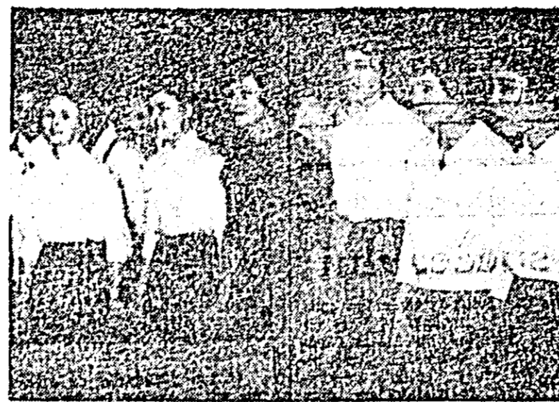
Dintre brigăzile artistice de agitație prezente la faza orăștească a celui de-al VII-lea concurs republican, o comportare frumoasă a avut-o și cea de la întreprinderea „Fierarul” pe care o vedeți în fotografii.