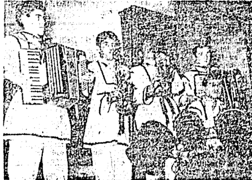
Orchestra de muzică ușoară a căminului cultural din cartierul Piravea.

Artistică. Desigur, îmbinarea organică dintre activitatea amatoare și cea profesională explică, în bună parte, multe realizări meritabile. Nu trebuie însă uitat că s-a mai observat la unele formații o mișcare scenică neadecvată necesităților textului, o anumită stilgăcie, iar, pe alocuri, un slăbiciuism supăraător, după cum am mai observat și unele serioase deficiențe de dicțiune. Desigur, aceste, mai ales la brigăzile tinerilor, sunt cauzate de o anumită neînțelegere a rolului didactic și declarativ, artistic nu naturalist. Metoda realist-socialistă nu are nimic comun cu naturalismul. Pe alocuri s-a mai observat o neconcordanță între conținutul de idei al textului și melodia pe care se cântă. A cânta un text pe o melodie nepotrivită este la fel de supăraător ca a dansa în dans bănețean în costum de săliște, lucru pe care la fel l-am constatat.