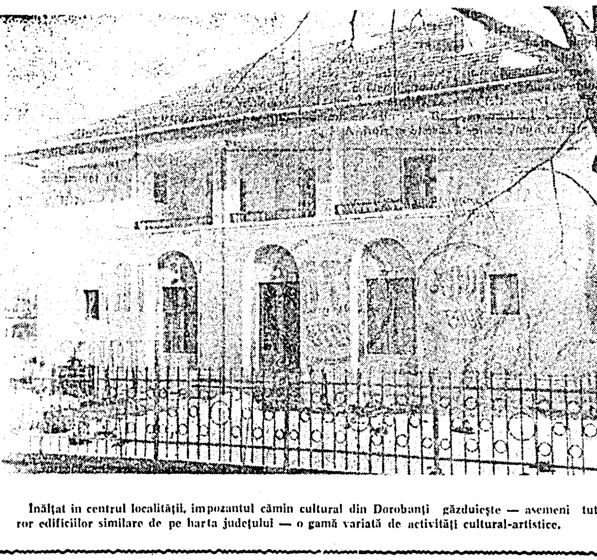
Înălțat în centrul localității, impozantul cămin cultural din Dorobanți găzduiește — asemenea tutu-ror edificiilor similare de pe harta județului — o gamă variată de activități cultural-artistice.