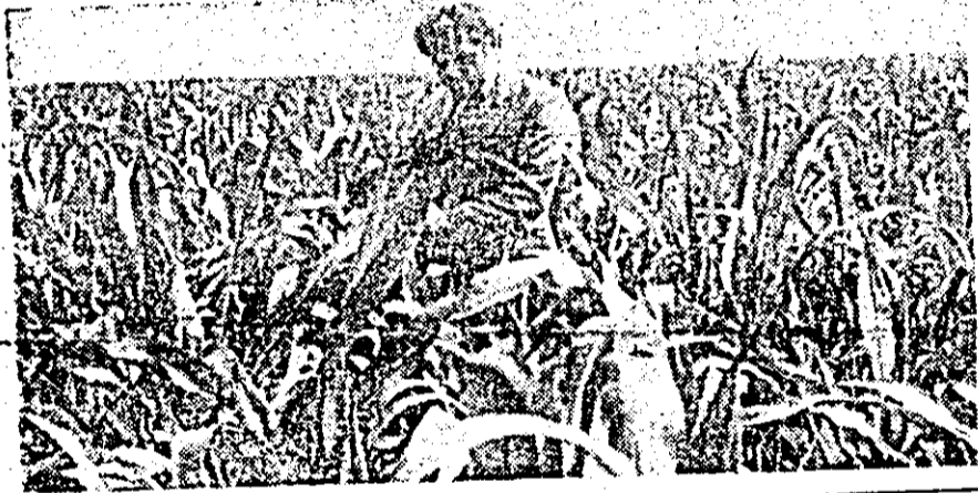
Deși nu e mic de statură, inginerul șef al I.A.S. Ineu este „concurat” de porumbul femel a II-a...