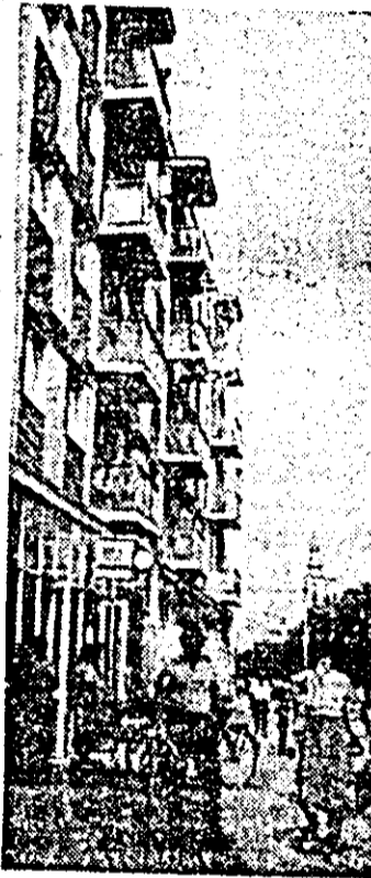
Vedere din Ineu.

ORIENTARE SPORTIVĂ. Astăzi, la pădurea Vladimirescu și mâine, la pădurea Coala se desfășoară etapa județeană pentru seniori la individual și stafetă.