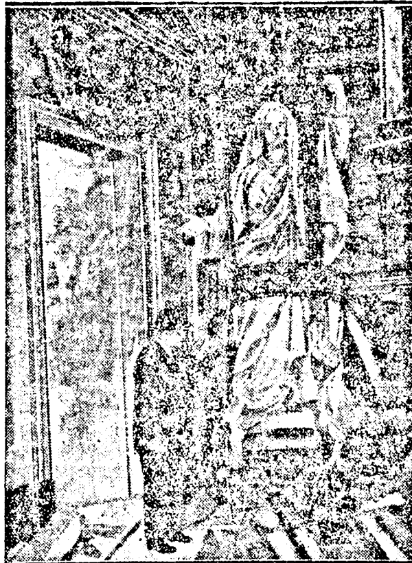
XI. Piusnak 50 éves papi jubileuma alkalmából az olasz katolikusok egy márványszobrot ajándékoztak. Ezt a Chiesa di S. Carlo al Corso nevű római templomban állították fel, ahol a pápa ötven évvel ezelőtt első miséjét mondta.