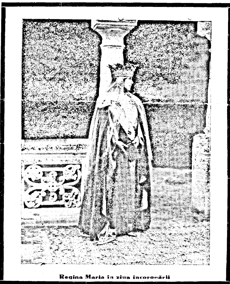
Regina Maria în ziua încoronării

Regina Maria ședea cufundată într'un jilț din camera El de lucru dela Peșor, când îmi spunea aceste cuvinte. O rază de soare, ce pătrun- dea prin fereastră, se oprise în părul ei auriu și, pentru o clipă privind-o,