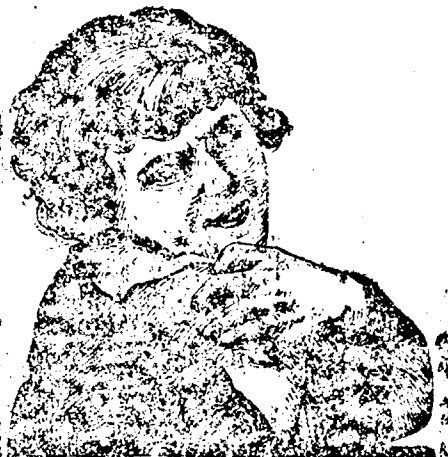
Az igazgatóság pénzügyi hivatalának azonnali eltűnése a CADUM-KENOCST használja