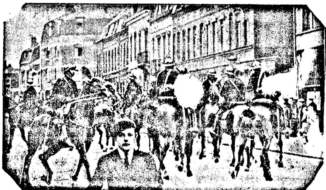
Die Zahl der Streikenden in Nordfrankreich beträgt nach Schätzungen 140.000 Mann. Es sind in dem Streikgebiet bereits große Truppenmassen zur Aufrechterhaltung der Ruhe und Ordnung zusammengezogen. Im Zentrum des Streikgebietes liegt Roubatz, wo es verschiedentlich zu Zusammenstößen zwischen Polizei und streikenden Arbeitern kam.

Polizei zerstreut Kundgebungen vor dem kommunistischen Lokal in Roubatz.