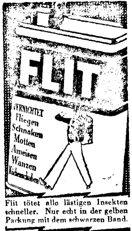
Flit tötet alle lästigen Insekten schneller. Nur echt in der gelben Packung mit dem schwarzen Band.