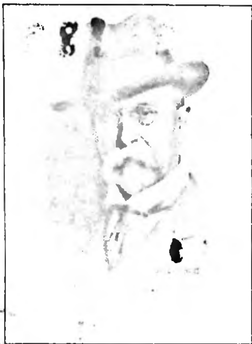
T. G. MASARYK