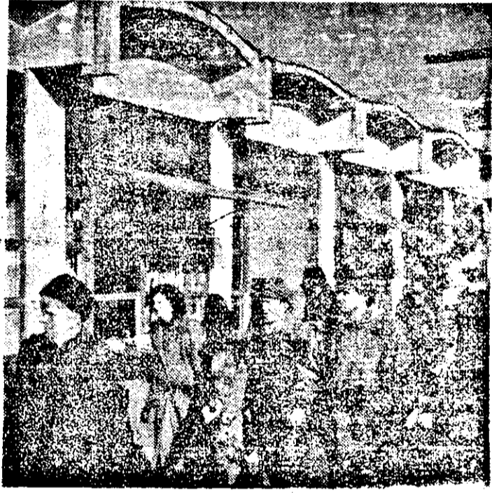
În sfîrșit, Piața Mihai Viteazul oferă acum condiții propice pentru un comerț „de piață” civilizată. Deci, se poate! Pe cînd, la fel, și alte zone ale municipiului? Că tare mai au nevoie!

le la fondul de stat în anul 1992 au fost: de 26.489 tone la grâu și secară. (—64.398 tone față de anul 1991), 59.906 tone la porumb boabe (+41.018 tone), 20.320 tone floarea soarelui (+9.945 tone), 3.734 tone cartofi de toamnă (—3.725 tone), 14.773 tone carne în viu — total (—15.761 tone), 391.654 hl. lapte de vacă, 3,5 la sută grăsimi (—145653 hl.) 45.233 mii buc. ouă pentru consum (—10.745 mii buc.)