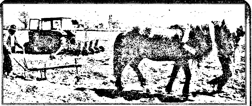
De la cal la tractor sau de la tractor înapoi la cal - o diferență nu doar de „cal putere”, ci și de mentalitate, de o jumătate de secol înainte sau înapoi.

Cititi în pagina a 5-a „Adevărul” la sate: O primăvară ca un blestem