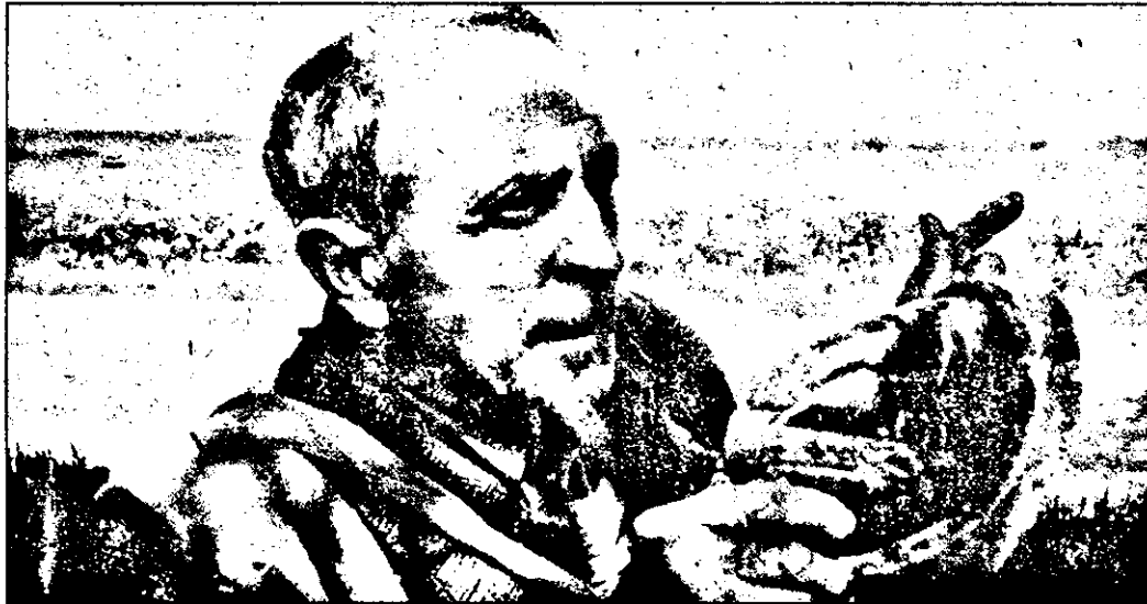
„Ce vom face cu porumbul? Vom ajunge, oare, ca americanii, să-l aruncăm în apă?”