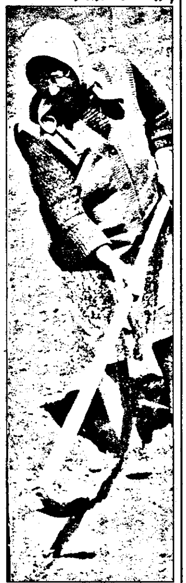
„Dacă plăteam toate lucrările, nu știu cum ieșeam. Guvernul ne promite multe, dar face încă prea puțin pentru țărani”.