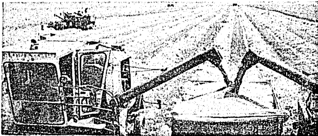
La CAP Felnac secerișul grâului se desfășoară din plin.